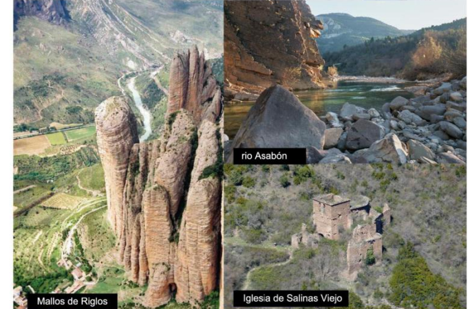
Mallos de Riglos