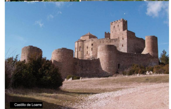
Castillo de Loarre