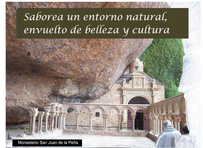
Monasterio San Juan de la Peña

Saborea un entorno natural, envuelto de belleza y cultura